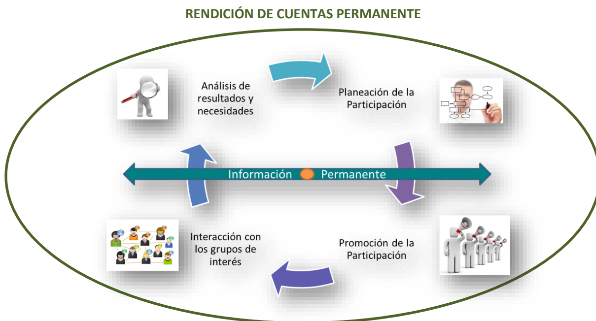
Gráfico No 1

La siguiente ilustración presenta de manera gráfica la conceptualización del Esquema de Participación Ciudadana diseñado por CISA: