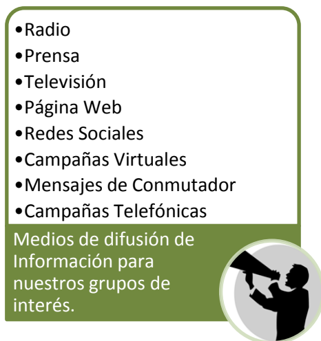
Gráfico No. 2

Se trata de desarrollar e implementar una estrategia integral de comunicación que permita dar a conocer la Entidad, su portafolio de productos y servicios, los programas y proyectos en ejecución, así como información de interés para los diferentes segmentos: ciudadanos, clientes, entidades del Estado y público en general y de contar con herramientas que faciliten la interacción de CISA con los diferentes segmentos.