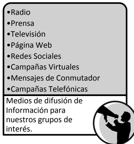
Gráfico No. 2

Se trata de desarrollar e implementar una estrategia integral de comunicación que permita dar a conocer la Entidad, su portafolio de productos y servicios, los programas y proyectos en ejecución, así como información de interés para los diferentes segmentos: ciudadanos, clientes, entidades del Estado y público en general y de contar con herramientas que faciliten la interacción de CISA con los diferentes segmentos.